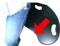
膝裏があたりにくい形状