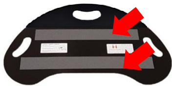
裏面に2本の滑り止め